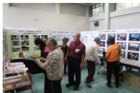
広報委員会ブースでは山口まちづくり推進協議会の様々な活動を紹介しました。