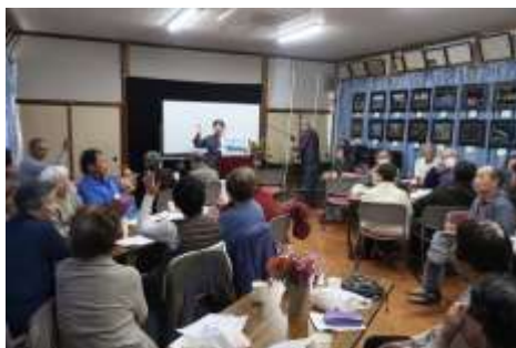
地元の民話「弘法の三ツ井戸」と誇るべき山口小の歴史が語られました。

自治会・町内会の枠を越え、皆で大鐘公民館に集まって元気に楽しんで欲しいという主催者の思いが伝わる催しでした。