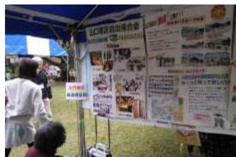
山口自治連の活動紹介ポスター、内容が分かりやすく好評でした。

山口地区自治連会合（山口自治連）は防災訓練とふれあいスポーツ大会の様子と、山口地区の人たちが参加して 1 年がかりで作成した「所沢山口ほほえみウォーキングマップ」を紹介し、好評でした。