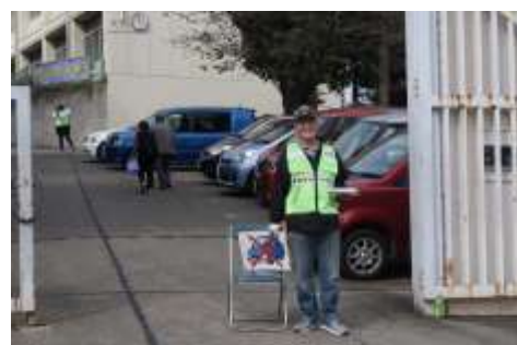
裏方だけど無くてはならない駐車場係、お疲れ様でした。

文化祭で展示した「所沢山口ほほえみウォーキングマップ」は まちづくりセンターのロビーで配布中。山口の歴史探訪に、健康づくりに、仲間作りにぜひご活用下さい。