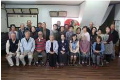
準備をした人も参加を楽しんだ人も、皆さん生き生きとしています。

昼食後は、会館で囲碁などを楽しむグループと外を歩くグループに分かれました。外歩きグループは近くの立派な庭を鑑賞させて戴いた後、狭山湖霊園で有名人の墓巡りをしました。