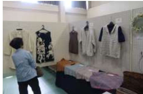
「だれでもなんでも展」(個人作品)はたくさん作品が並びました。