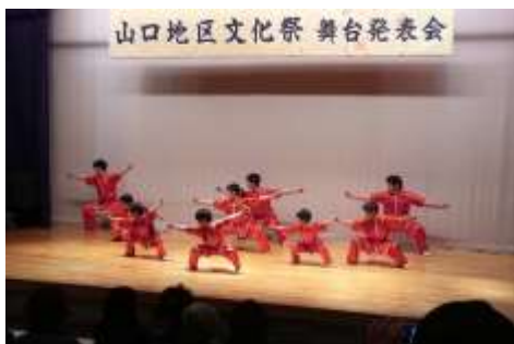
子どもたちの中国武術演武、カンフー映画のように宙を舞う身の軽さに驚きます。