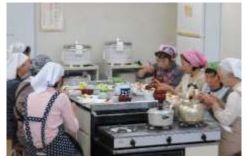
出来立てはおいしいです。

第2回は2月20日(木)の予定です。詳細は山口地域包括支援センター(2928-7525)にお問合せ下さい。