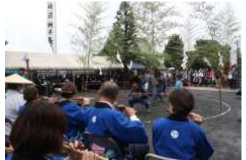
2 日間の延期にも拘わらず、大勢の人が来場し伝統の箆獅子舞を堪能しました。

1 時間近くに及ぶ長い舞ですが、来場した大勢の人たちは分かりやすい解説を聞きながら勇壮な獅子や可愛らしい箆子の所作に見入りました。