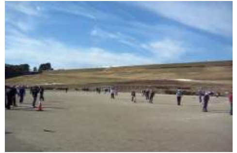
秋晴れの下でのプレイは気分爽快です。

最後に優勝をはじめ各賞の表彰式が行われ、お互いの成果を讃えました。ちなみに上位 5 位の中の 3 名は 75 歳以上、年齢は関係ないようです。