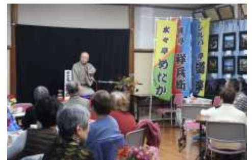
落語は話の流れが理解できないと笑えません。脳の活性化に役立ちます。