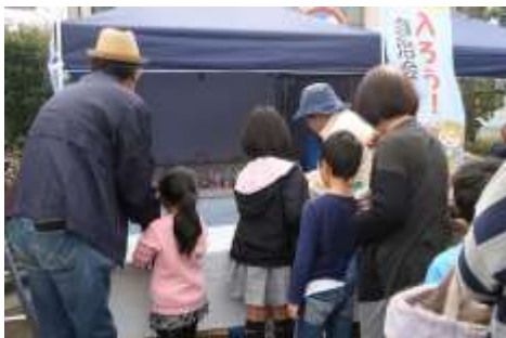
今年初登場の射的には子どもたちの長い列ができました。