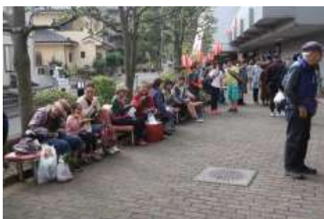
模擬店前では大勢の人たちが焼きそばなどを頬張りながら一休み。

約 2,000 人が来場、作品展示、舞台発表、イベント、模擬店、菊花展、どこの会場も大賑わいでした。作品展示や模擬店では地元の小中学生も大勢参加、活躍しました。