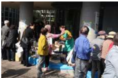
昨年までの「福祉バザー」を引き継いだ「山口まごころバザー」も大人気でした。