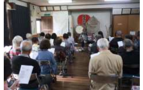
カラオケとは一味違う雰囲気青春時代を懐かしく思い出したことでしょう。