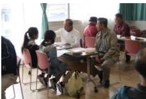
仲良く囲碁を教わりました。仲邑董初段に憧れたのでしょうか。