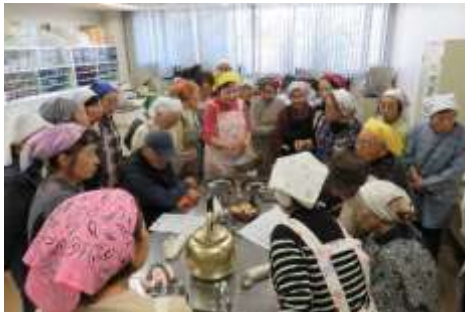
先生から作り方を聞いてます。

「山口絆カフェ」は認知症予防・物忘れが気になる方をはじめ、どなたでも歓迎します。